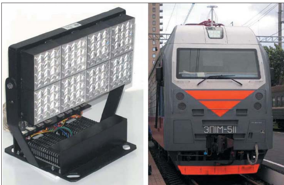
Рис. 1. Внешний вид прожектора ЛПБ-01

Лобовой прожектор ЛПБ-01 предназначен для освещения пути перед локомотивом в темное время суток. Источником света служат мощные светодиоды белого цвета свечения со специальной оптической системой, использующей линзы Френеля. Для обеспечения максимального рассеивания и передачи тепловой энергии светодиоды смонтированы на алюминиевую плату. Корпус прожектора имеет специальную эффективную поверхность для обеспечения теплового режима светодиодов. Конструкция прожектора обеспечивает возможность регулировки направления луча в горизонтальной и вертикальной плоскостях не менее \pm 5^\circ . Установочные и присоединительные размеры ЛПБ-01 позволяют использовать его взамен существующих прожекторов — на обеих лобовых частях локомотива