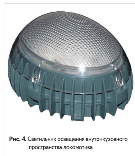
Рис. 4. Светильник освещения внутрикузовного пространства локомотива